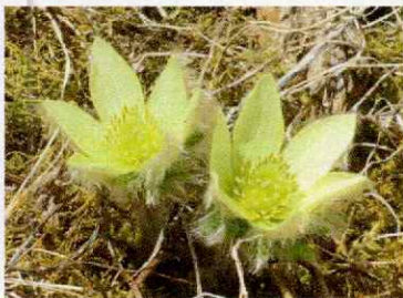
ツクモグサ(5月下旬～6月下旬)