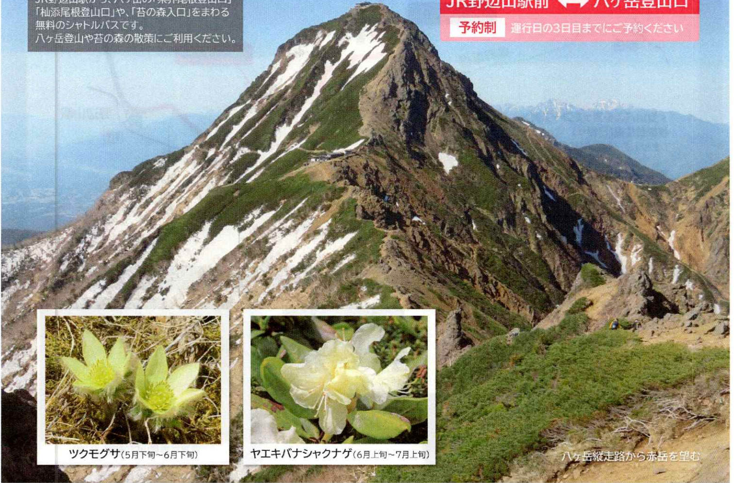
八ヶ岳縦走路から赤岳を望む