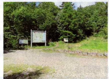
杣添尾根登山口(仮設トイレ有)