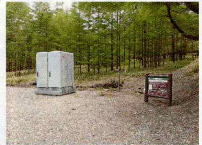
県界尾根登山口(仮設トイレ有)