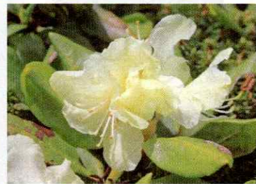
ヤエキバナシャクナゲ(6月上旬～7月上旬)